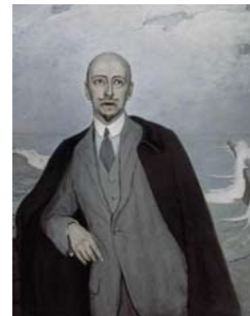
Romaine Brooks, Retrato de Paul Morand (1925)

La colección de escultura está compuesta de obras destacables (Barye, Rodin, y sobre todo Camille Claudel).