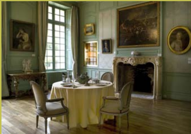
Vista interior del museo