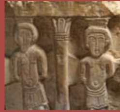
Los dos ladrones, detalle de una decoración de un pie de cruz Hipogeo de las Dunas, (siglo VII)

Este oratorio, edificado en los confines de una necrópolis antigua por el abad Mellebaude, es uno de los monumentos más elocuentes de la Alta Edad Media. Cerrado al público por medida de conservación, es actualmente objeto de trabajos de restauración y de investigación internacional.