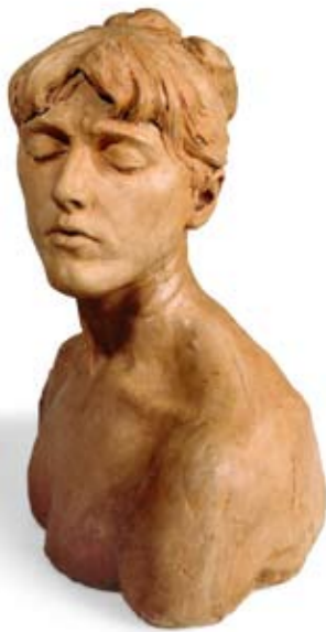
Camille Claudel, Mujer joven con los ojos cerrados (1885)

Las modificaciones de la exposición permitirán en los años 2008-2011 una mejor presentación de las ricas colecciones de Bellas Artes del museo Sainte-Croix.