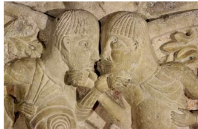
Capitel de « La Disputa » Calcáreo (siglo XI)

En la planta baja, la copa relicaria de la abadía de Saint-Savin-sur-Gartempe (vidrio excepcional, único en Europa) introduce al visitante en la Edad Media. La escultura medieval, proveniente por lo esencial de edificios desaparecidos, recuerdan que el Poitou fué un gran centro del arte románico del cual el capitel de « la Disputa » es la mas bella obra maestra.