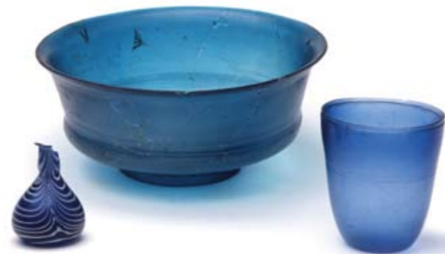
Vidriería de origen italiano proveniente de Antran - Vienne (1º siglo despues de J-C)

Además de los muros de habitaciones conservados in situ , las esculturas descubiertas en la ciudad antigua y sus alrededores revelan al espectador la romanización de Lemonum , la capital de los Pictones. El modo de vida, los cultos y las creencias, los ritos funerarios son evocados a través de las estatuas monumentales y también de los objetos de la vida cotidiana. De la Antigüedad tardía los testigos son los restos del mas viejo hornamento cristiano de estuco descubierto en Galia, los sarcófagos historiados, los objetos de adorno, los epitafios, las esculturas del hipogeo de las Dunas, todos evocadores del nacimiento del arte cristiano en el Poitou.