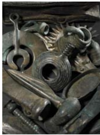
Presentación de Notre-Dame d'Or Objetos diversos, aliación cobrizca (Bronze final)

Atena - Marmol (1º siglo despues de J-C) ▶