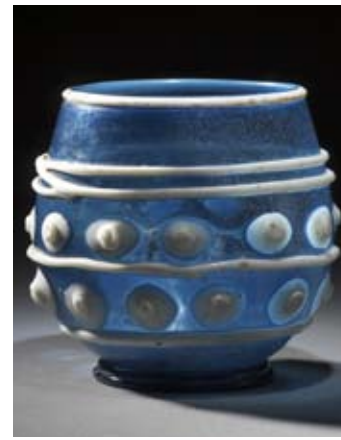
Vase-reliquaire Verre Abbaye de Saint-Savin-sur-Gartempe Production d'Europe occidentale (XI e s.)

Au rez-de-chaussée, le vase-reliquaire de l'abbaye de Saint-Savin-sur-Gartempe (verre bleu d'exception, unique en Europe) introduit le visiteur dans le Moyen Âge. Les sculptures médiévales, qui proviennent essentiellement d'édifices disparus, montrent que le Poitou fut un grand foyer d'art roman, dont le chapiteau de « la Dispute » reste le plus beau chef-d'œuvre.