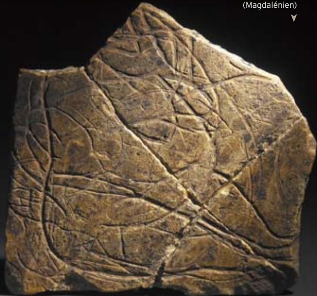
Grotte de la Marche Plaquette de calcaire gravée figurant une femme assise (Magdalénien)

Remarquables pour l'époque paléolithique, les étranges gravures de la grotte de la Marche occupent une place particulière dans l'art magdalénien. Le Néolithique est abondamment illustré par le riche mobilier de la collection Patte : céramique, silex, outillage osseux, parure provenant des sites de Saint-Martin-la-Rivière, Bellefonds, Fleuré, Puyraveau. Le Camp Allaric (fouilles Pautreau) est exceptionnel ; les niveaux protohistoriques ont notamment livré de la poterie à décor peint et incisé (figures géométriques, anthropomorphes). Des dépôts de l'Âge du Bronze (Notre-Dame d'Or, Le Verger-Gazeau, Vénat) et du mobilier funéraire du premier Âge du Fer (sépulture du Mia) sont exposés aussi dans cette section.