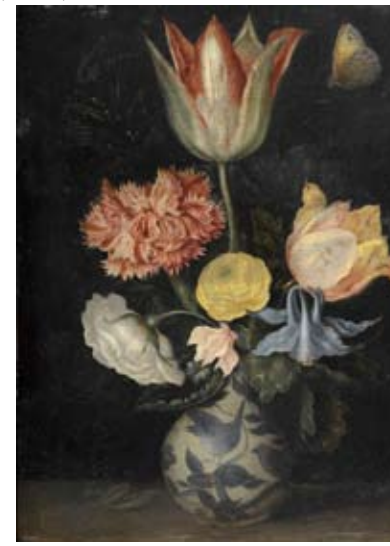
Vase de fleurs avec un papillon (début du 17 e s.) Ambrosius Bosschaert l'Ancien (attr.) Huile sur cuivre

Deux autres salles complètent cette présentation : les Ingresques, autour d'un tableau d'Ingres ; les peintres officiels du Poitou ayant mené carrière dans la capitale. Une dernière salle évoque le Symbolisme, autour des œuvres de Gustave Moreau, Eugène Carrière, Odilon Redon, Camille Claudel, Auguste Rodin.