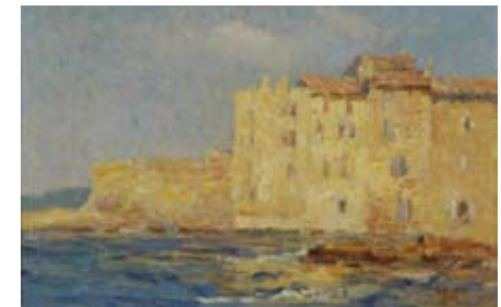
Georges Bobin Maison de pêcheurs à Saint-Tropez (1908)

Une nouvelle galerie d'études permet de se familiariser avec les collections modernes du musée, autour de la peinture et de la sculpture.