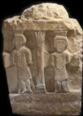
▲ Les deux larrons Détail d'une Crucifixion monumentale Calcaire Hypogée de Mellebaude (VII e -VIII e s.)

L'oratoire mérovingien, aménagé aux confins d'une nécropole romaine par l'abbé Mellebaude, est l'un des monuments les plus éloquentes du haut Moyen Âge par les inscriptions et les sculptures uniques en Europe qu'il renferme. Fermé au public par mesure conservatoire, il va faire, à partir de 2009, l'objet d'une campagne de restauration. Le site, de renommée internationale, reste accessible aux équipes de recherche nationales et internationales sur demande.