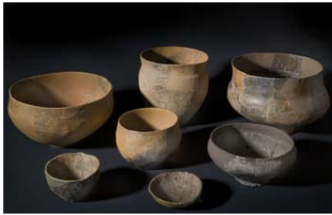
Ensemble de vases en terre cuite (fouilles J.-P. Pautreau) Camp Allaric, Aslonnes (Vienne) - Premier âge du Fer

Outre les vestiges d'habitations conservés in situ , les œuvres sculptées découvertes dans la ville antique ou ses environs rappellent au visiteur la romanisation de Lemonum , capitale des Pictons. Mode de vie, cultes et croyances, rites funéraires sont évoqués à travers les objets de la vie quotidienne mais aussi par la statuare au sein de laquelle se distingue une statue d'Athéna, copie italienne du 1 er siècle après J.-C. d'une œuvre grecque. De l'Antiquité tardive témoignent les restes du plus ancien décor de stuc chrétien découvert en Gaule, des sarcophages historiés, des objets de parure, des épitaphes, qui évoquent la naissance des arts chrétiens en Poitou.